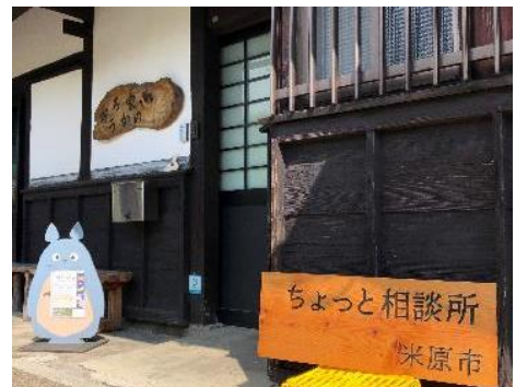
介護・認知症のことご相談ください。