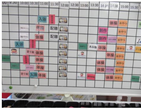
活動メニューの選択