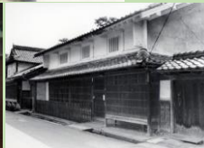
昭和 40 年頃