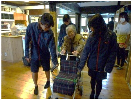
柏原中学校 (地域交流)