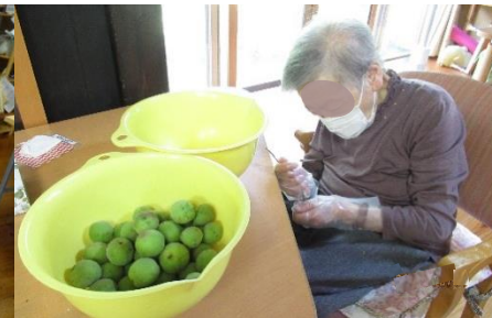
梅ジュースづくり