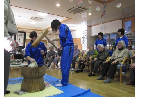
伊吹山中学校との交流