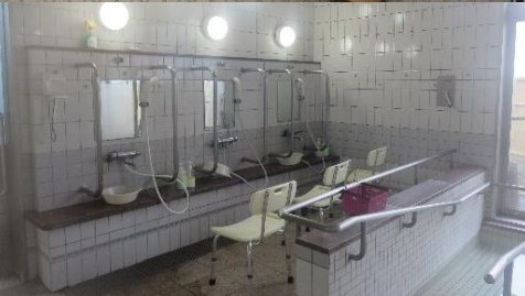
一般浴 (リフト付き)