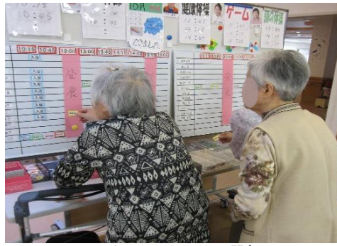
活動メニューの選択