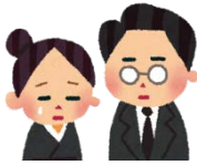
急な冠婚葬祭のあ いだ預かる