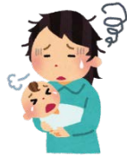
保護者が病気で 通院するあいだ預かる