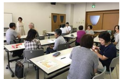
傾聴ボランティア養成講座