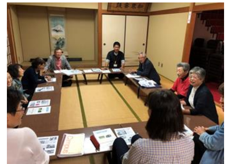
福祉懇談会の開催