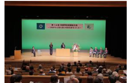
第14回社会福祉大会