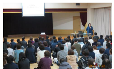
福祉・介護職員合同研修