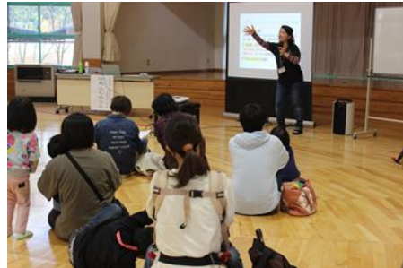
子育て講演会の開催